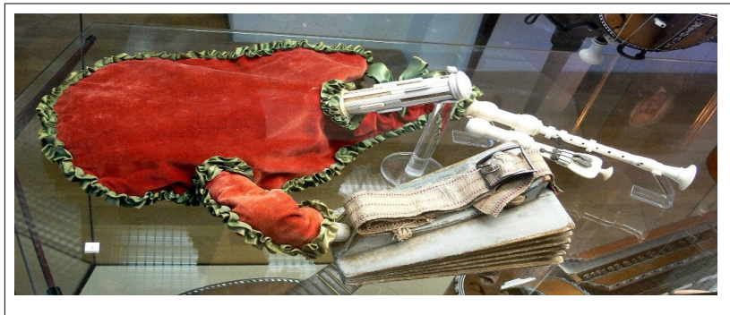
Musette de cour