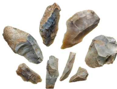
Outils du Néolithique

L'élément le plus surprenant est la mise au jour de plus de 60 éclats de silex et d'outils façonnés datant de la fin du Mésolithique, début du Néolithique, soit environ 4 300 ans avant notre ère. Ces objets ont été trouvés dans des dépôts de sable intacts qui faisaient autrefois partie de Thorney Island , l'îlot marécageux sur lequel Westminster a été bâti. Cela prouve que le site était occupé par des communautés de chasseurs-pêcheurs bien avant l'édification de monuments comme Stonehenge.